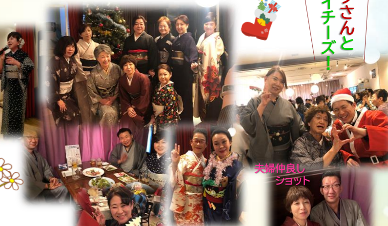
サンタさんと ハイチーズ!