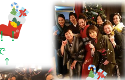
皆さんととっても 美しいですね(^_^)♪