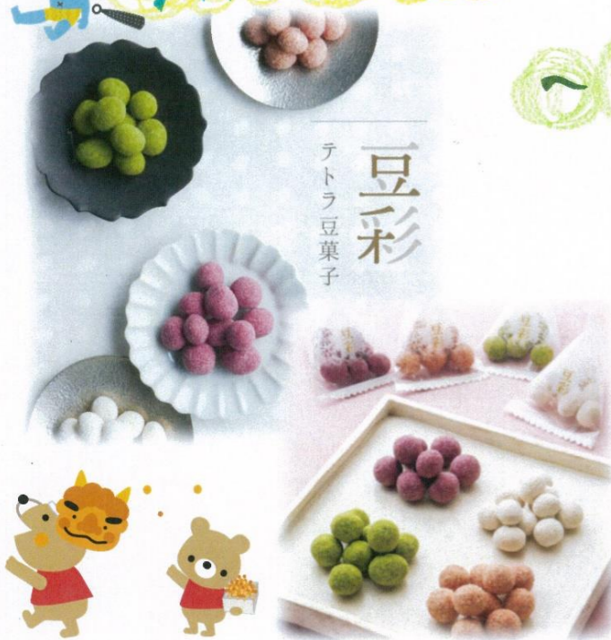
豆彩 テトラ豆菓子