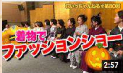
着物ファッションショー inハロウィンパーティー! ~北...