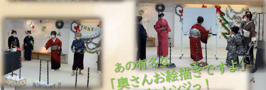
あの有名な 「奥さんお絵描きですよ」 にチャレンジっ！