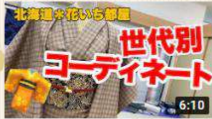
一つの着物で作上げる「世代別コーディネート」~30...

私の一番最初のコーディネート紹介なので緊張していましたがとても気に入っています(^_-)-☆