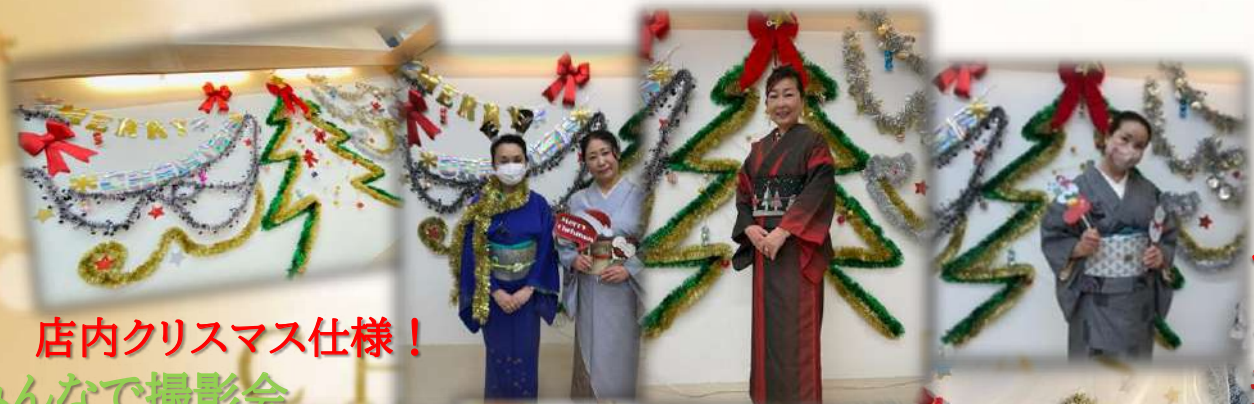
店内クリスマス仕様！ みんなで撮影会 もしました～(^^)

大変お待たせいたしました！ みなさんのおかげで少人数ながら 楽しく行うことが出来ました(^-^)