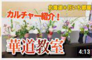
「華道教室」カルチャー教室紹介! ~北海道の着物専門...