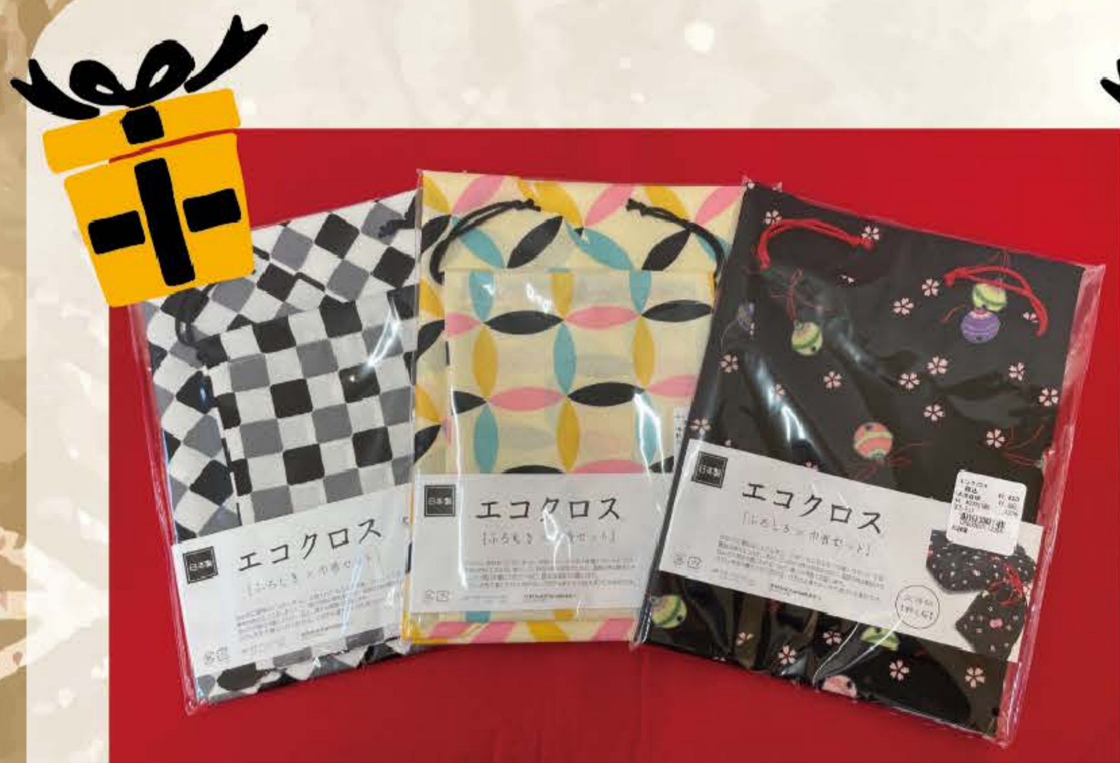
エコクロス (ふろしき × 巾着セット) 各 ¥1,430(税込)

包むのに便利な「ふろしき」と、小物入れにもなる「巾着」のセットです。買物の時はエコ風呂敷として、旅行の時は荷物まとめに、温泉の時は着替えを包んで小物は巾着に入れてなど。様々な場面で活躍します。