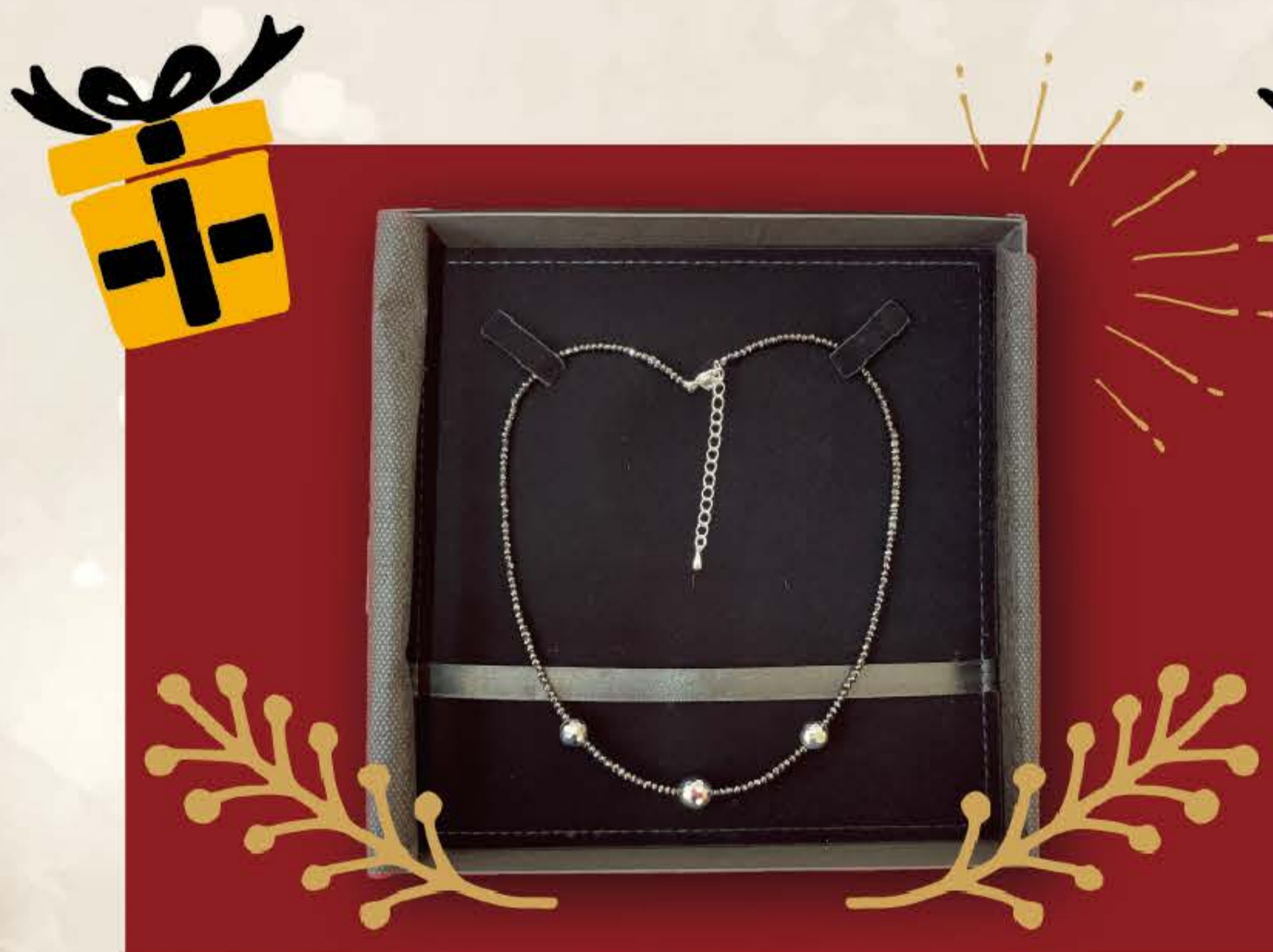
ベルメナーズネックレス ¥8,800(税込)

シンプルなデザインで服装を選ばず、幅広いコーディネートにお使いいただけますネックレス。多角形にカットングすることで輝きがより広がる構造となっています。胸元のアクセントとしてご利用ください。