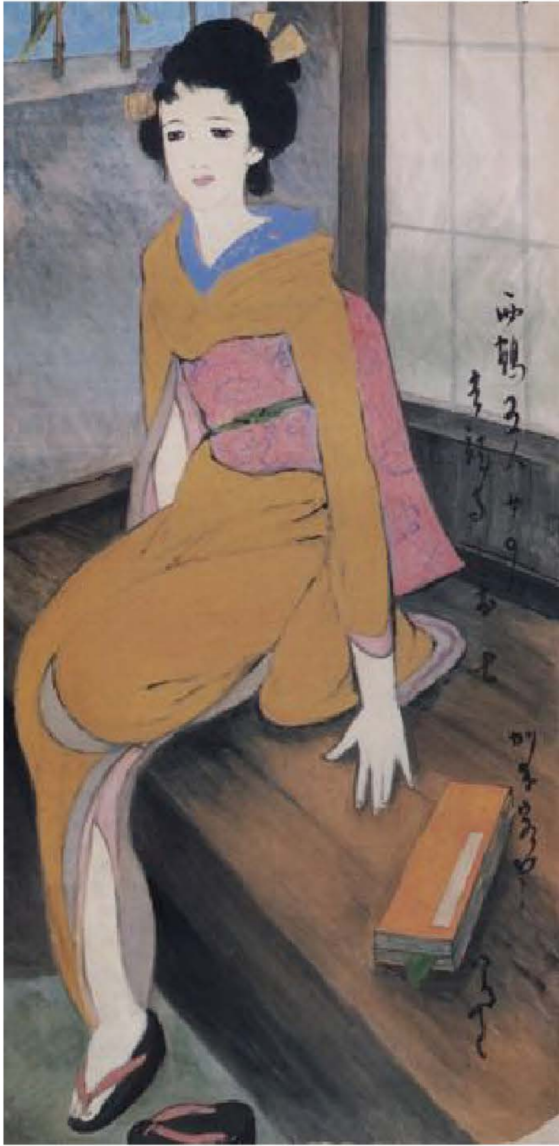
▲竹久夢二の美人画。 一世を風靡した「大正ロマン」を代表する画家。