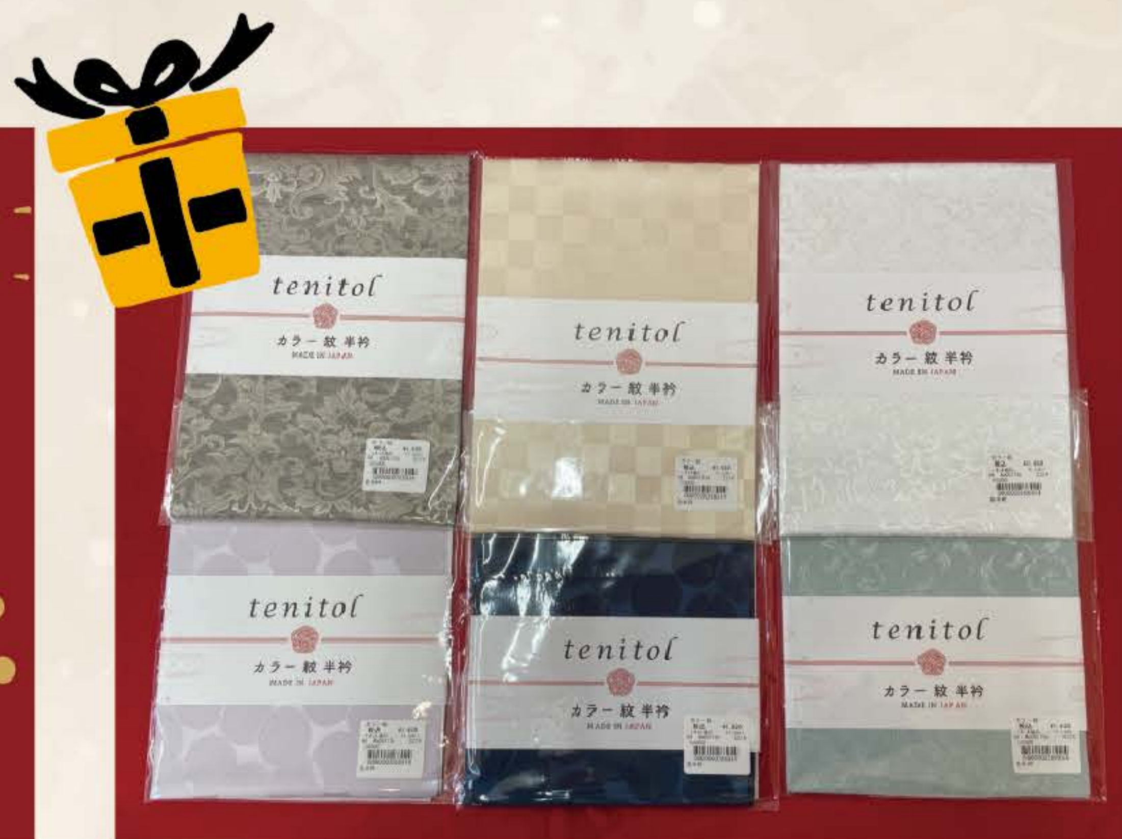
カラー紋半衿 各 ¥1,650(税込)

シンプルなデザインで服装を選ばず、幅広いコーディネートにお使いいただけますネックレス。多角形にカットングすることで輝きがより広がる構造となっています。胸元のアクセントとしてご利用ください。