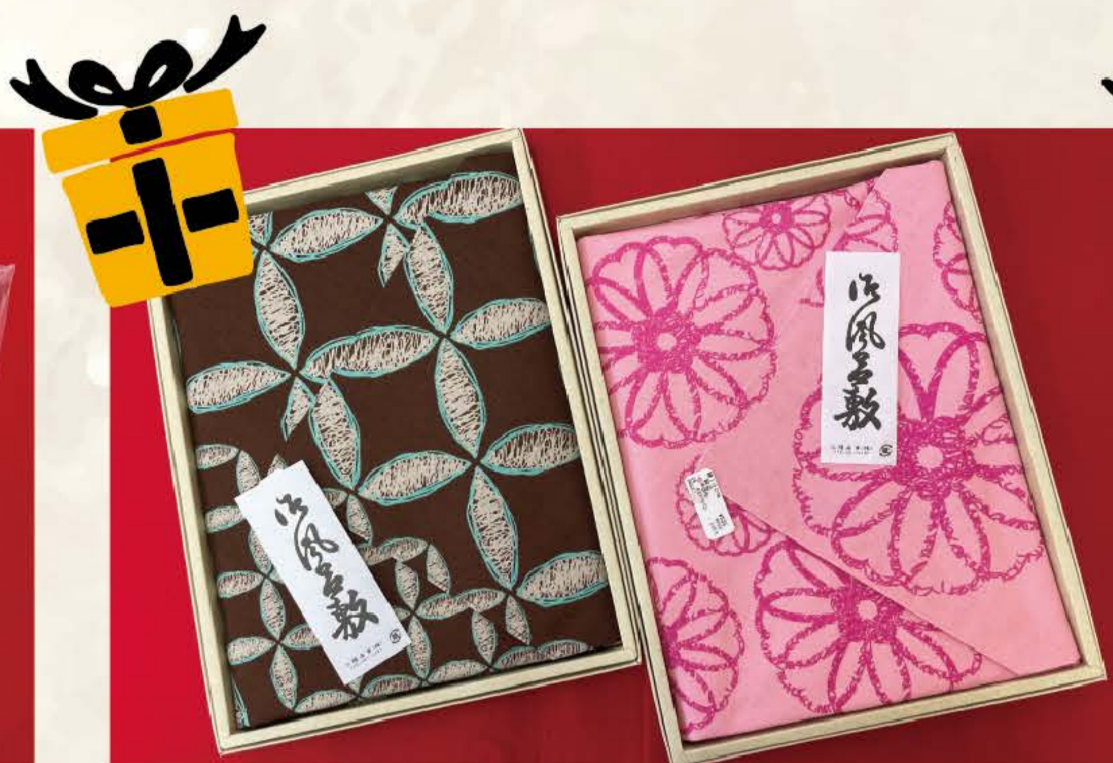
風呂敷 (箱入り) 各 ¥935(税込)

包むのに便利な「ふろしき」と、小物入れにもなる「巾着」のセットです。買物の時はエコ風呂敷として、旅行の時は荷物まとめに、温泉の時は着替えを包んで小物は巾着に入れてなど。様々な場面で活躍します。