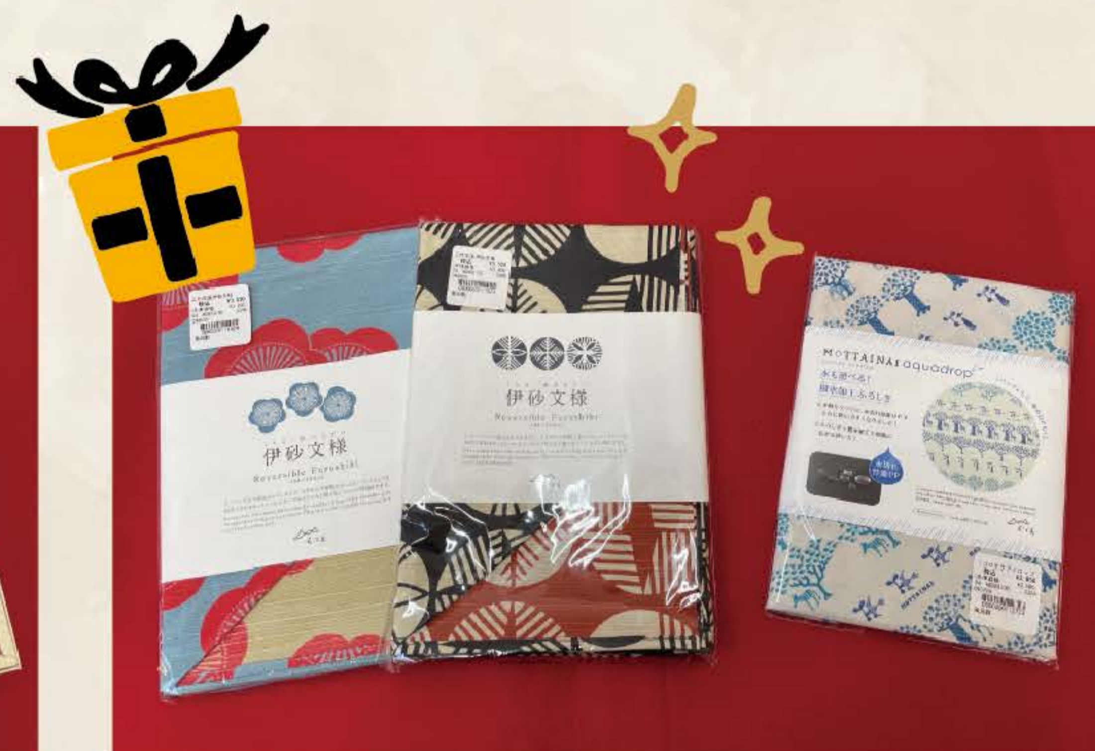
伊砂文様 (リバーシブル) 104cm × 104cm 各 ¥3,520(税込)

高級感のある化粧箱に入った綿 100%風呂敷。リーズナブルで贈り物に最適です。もちろんご自分用にもご利用いただけます。お着物との相性抜群な色柄をご用意致しました。1枚あると何かと便利なサイズの風呂敷です。