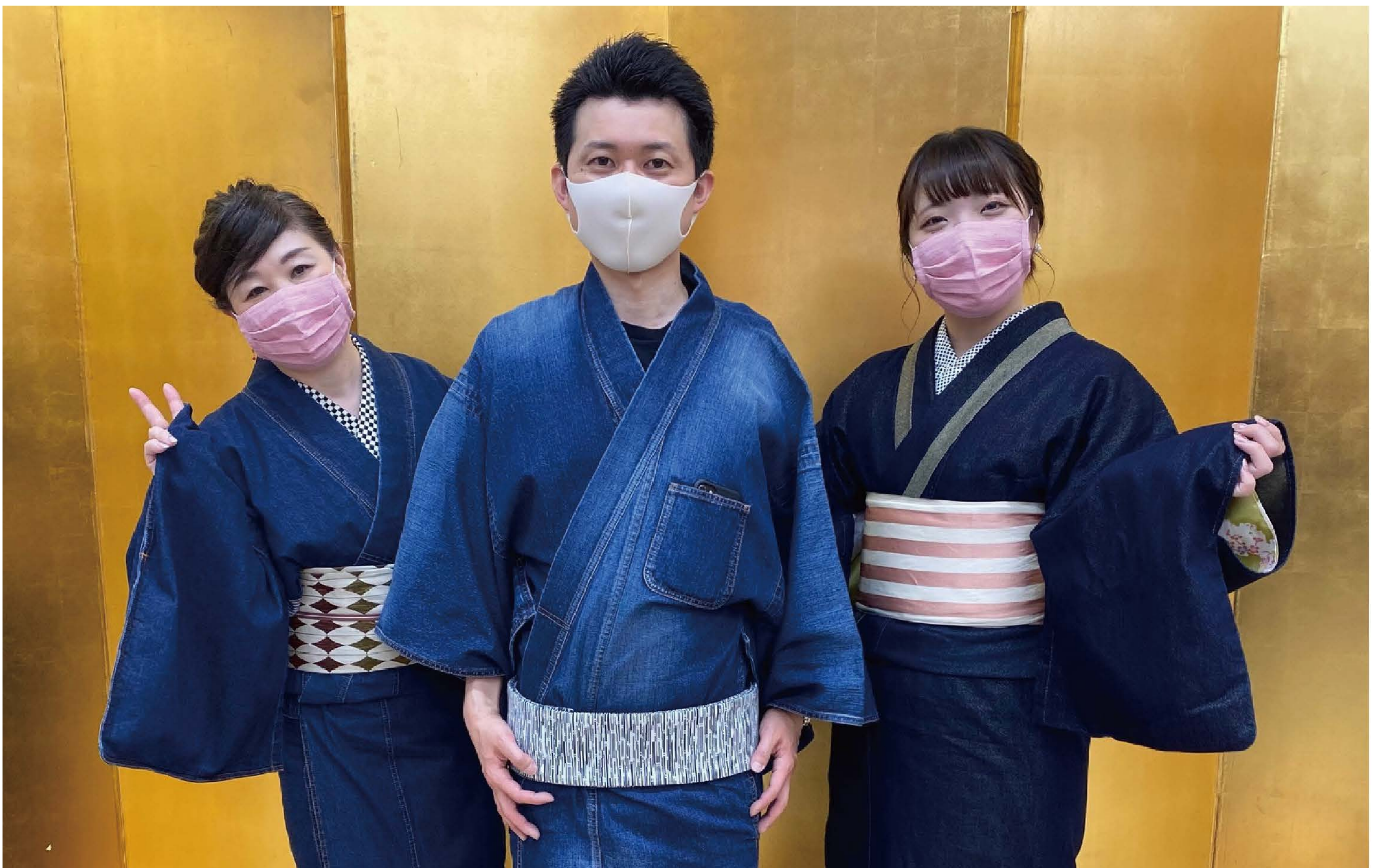
▲当店でもデニム着物を扱っております。男女問わず気軽に着られるのが魅力。 型にとらわれず、ふわっと着てみるのがおすすめです。