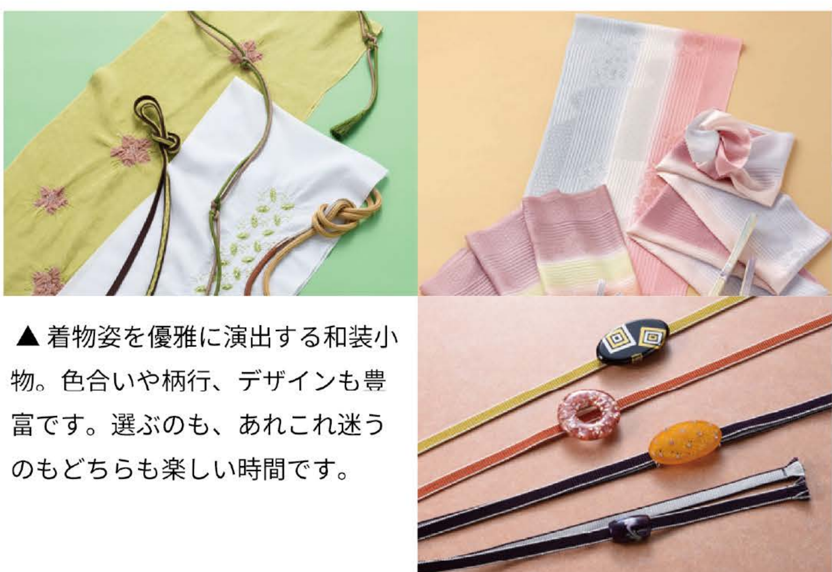
▲ 着物姿を優雅に演出する和装小物。色合いや柄行、デザインも豊富です。選ぶのも、あれこれ迷うのもどちらも楽しい時間です。

小紋は水玉や小花、幾何学模様又季節の花々など 洋服に近い柄も多くそういう総柄や飛び柄、プリ ントのワンピースをまとう様なフェミニンな女 子っぽさがある、身のこなしまで変わる気がし ます。洋服的なシンプルシックをベースにしなが らも、ときどきものならではの色合わせ柄合わ せも楽しめたらコーディネート幅が広がります。