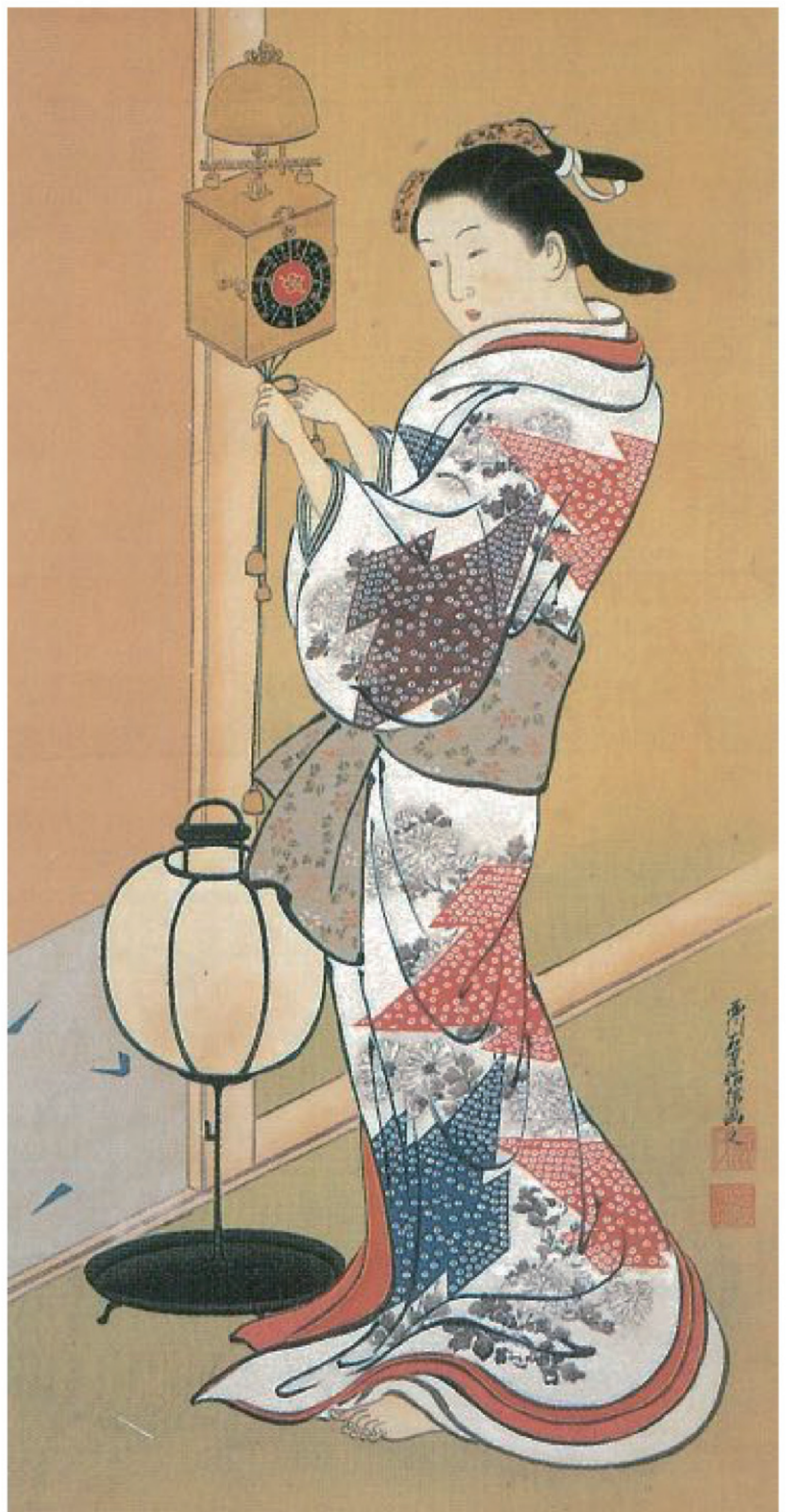
▲ 西川祐信 (にしかわすけのぶ) 「柱時計と美人」

→「白地の小袖に絞りの松皮菱の柄が大きく、菊の花を配し、いずれも遊女なのでゆらゆらとした、胸元は、殿方向きなのか…。」 現在の美装流の様に、きちんと衿にしたならば、「浮世絵」ではなく、「ただの美人画」になるのかしら？ 「七宝」も「松皮菱」も今だに伝わっている柄で、昔の人達の想像力の逞しさは本当に驚きの念を隠せません。帯も兵児帯を前で結んでいるのは遊女だろうか。赤い重ね衿もしている。 こんな風に、私が着物にどんどのめり込んだ過程には、身近な着物姿の女性の存在があり、着こなしの参考にした雑誌や浮世絵がありました。 その「おしゃれ」にワクワクしながら夢中で見て、少しずつ少しずつ私のなかにインプットされていったこと。それが今の私の「着物のコーディネート力」の源になっていることは間違いありません。