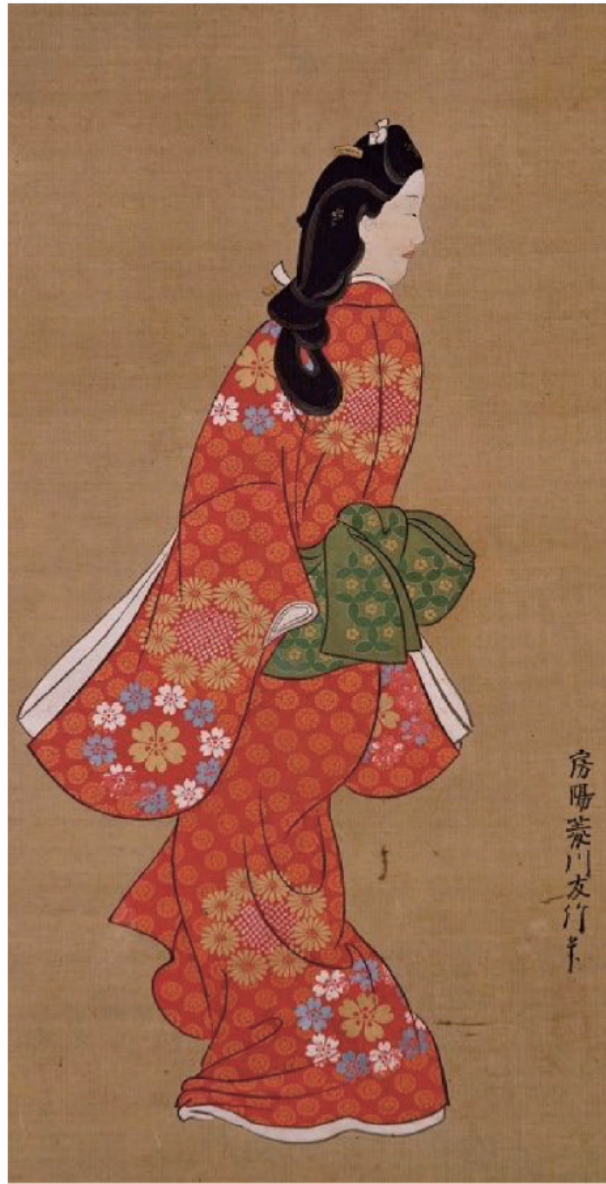
▲ 菱川師宣 (ひしかわもろのぶ) 「見返り美人図」 小振袖で帯は兵児帯の様に柔らかい素材らしく、後ろで文庫風に結んでいる。