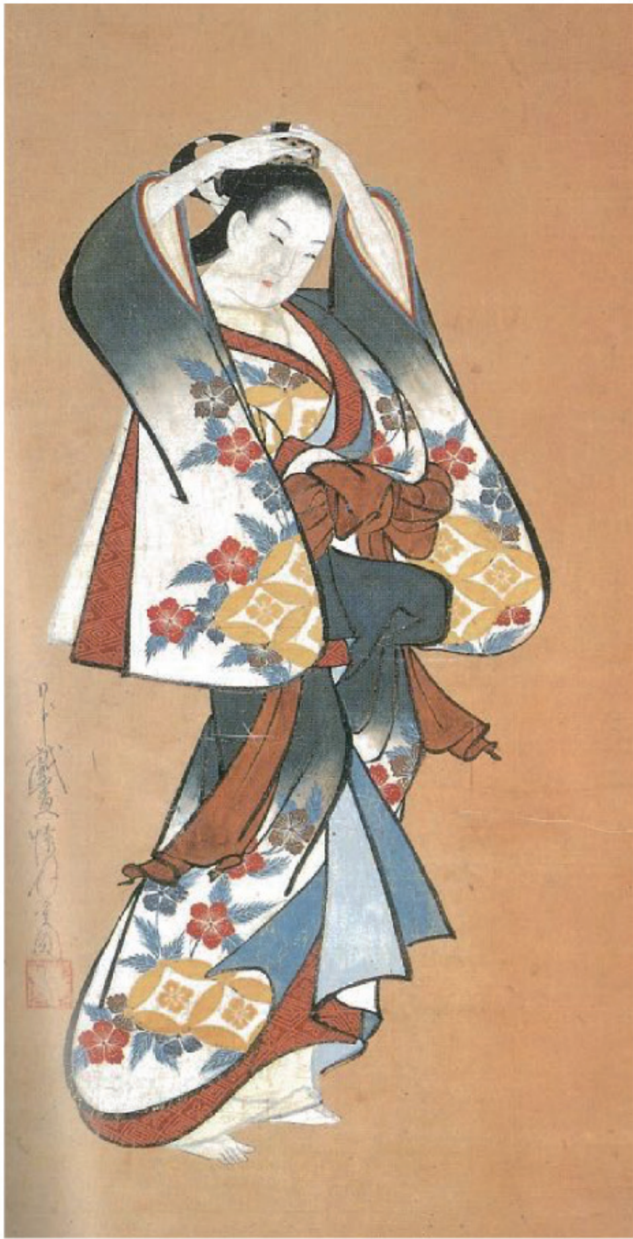
▲ 懐月堂安度 (かいげつどうあんどう) 「立美人図」 小振袖で、ほかしに七宝と花。遊女を描いたらしく、茶色の兵児帯を前で蝶結びにしている。

「花いち都屋」で仕事をされていて、お客様とのコミュニケーションを取る手立ての一環としての「かわら版」の表紙の担当になった際に、いろいろな資料を探している時、「浮世絵」や、着物姿を描く、画家として、「上村松園」や「伊藤深水」の本を購入し、見た事が挙げられるかしら？ 「浮世絵」は、時代的にも使っている色は限られている気がします。 浮世の絵を、版画で、あれ程の作品が出来るのは、本当にすごく、かの有名なゴッホが広重の浮世絵版画を自ら購入していた程なんですね！ 西洋の立体的な絵と比較すると、日本の版画や日本画は、平面ですが、私は、着物の帯や、半衿ばかりを見ていました。